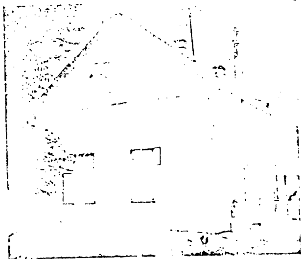
A régi jászberényi zsinagóga.