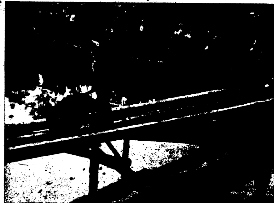
Cs. É. és F. Ferenc „Kubiknok”-e, felvétele.

— Ezt a földet a partmenti ingatlanokon halmoztuk fel. Egy részéből gödröket töltöttünk, a legtöbbet azonban ott hagyjuk és a parti tulajdonosokat a kincstár kárpótolni fogja. Körülbelül 80.000 köbméter földről van szó. Hallottam róla, hogy a városnak szándékában van ezt a földet, vagy annak egy részét legalább is, utak töltésére felhasználni. A gondolatot nagyon egészségesnek tartom, hiszen soha vissza nem térő alkalom ez, amikor a város ingyen jut ilyen óriási mennyiségű kitermelt földhöz. A fuvarkérdést is meg lehetne talán oldani közmunkával.