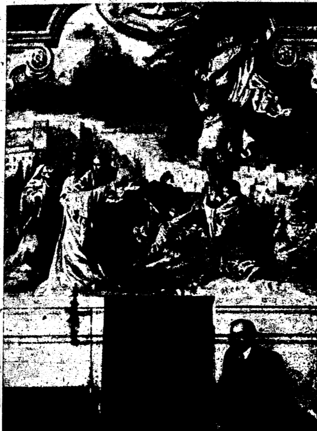
BENKE-LÁSZLÓ: freskó a csákvai r. kat. templomból.