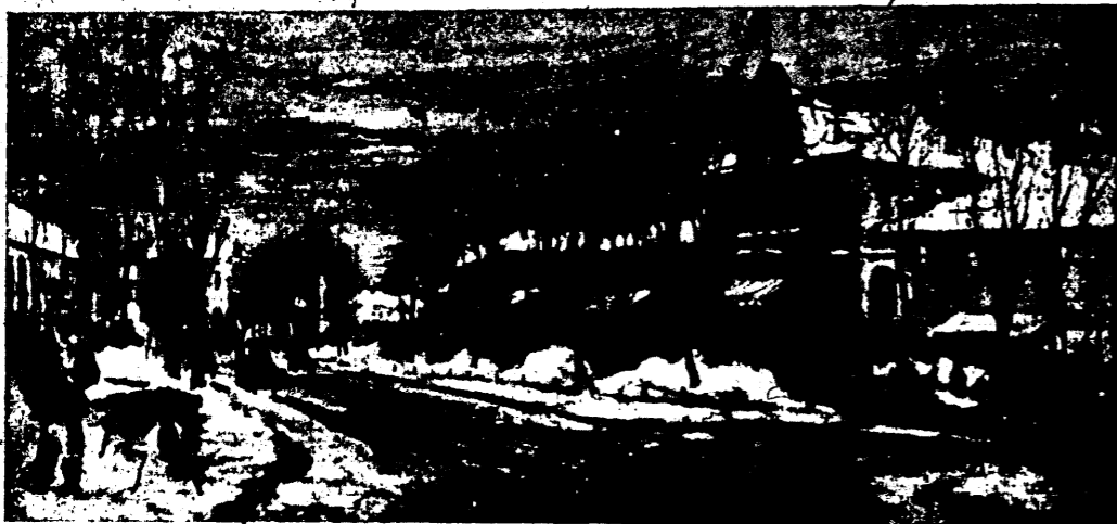
RÁCZ KÁLMÁN: Jászberényi heftipiac télen.