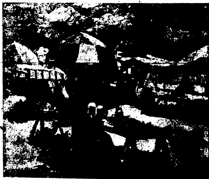
GY. RIBA JÁNOS: Gyöngyösi vásár. (Megvette Budapest székesfőváros.)

ORSZ. SZÉCHÉNYI-KÖNYVTÁR Hirlevelok és levelek 1842. év. 7303. sz.